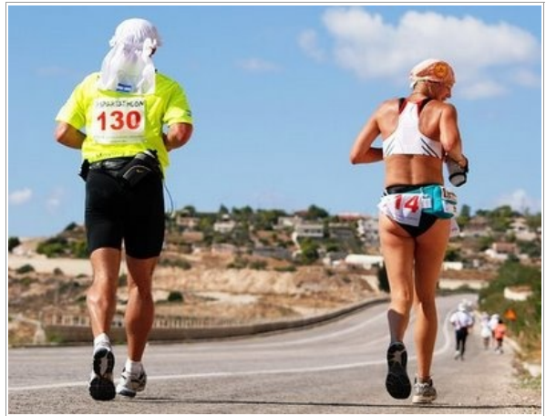
Medallas do Espartathlón:

O último gañador masculino foi Scott Jurek (EUA), e a última gañadora feminina foi Sook-Hue Hur (Corea do Sur), ambos no 2008.